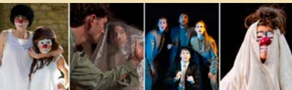
© Ben Harris - A. Meneghini - O. Dumay - G. Ison